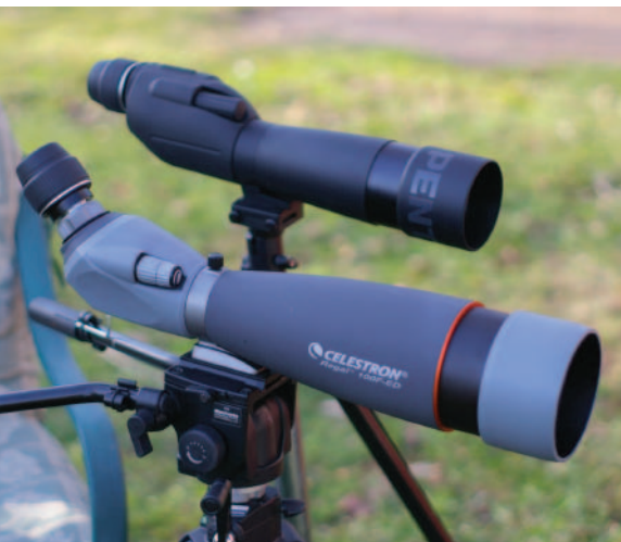
Камеры Celestron в комплекте с «родным» телескопом (на переднем плане) и телескопом Pentax PF-100 ED

воляет максимально «приблизиться» к тем или иным объектам и явлениям природы (например, таким, как шествие медведицы с медвежатами, «птичий базар», акт соития в семье диких кошек, столкновение льдин, поток вулканической лавы). Особенности конструкции подзорных труб делают их намного надежнее, выносливее объективов, и, в отличие от телескопа, подзорная труба намного легче и компактнее. Стандартное посадочное крепление для окуляра позволяет использовать всевозможные адаптеры для фотокамер, а также, в нашем случае, применять видеокамеру NexImage.