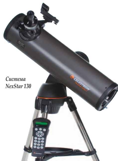
Система NexStar 130

Сам телескоп устанавливается на алюминиевом штативе, крепление – вилочное, с сервоприводами постоянного тока по обеим осям. Скорость наведения – 4 град/с, скорость слежения – «звездная», «лунная» и «солнечная», режимы слежения – азимутальный и экваториальный. Для удобства наведения в ручном режиме имеется гид (широкоугольный оптический искатель с