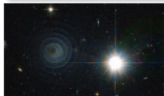
Изображения, полученные с помощью NexStar 130